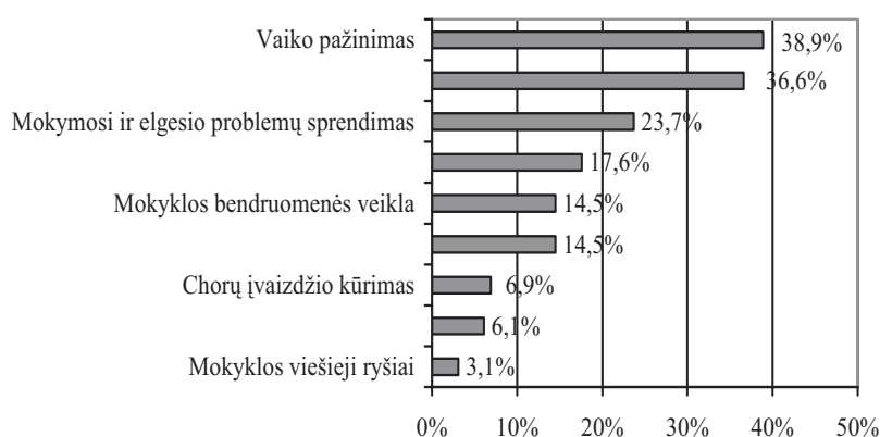
3 pav. Tėvų galimybės dalyvauti bendradarbiaujant su mokykla (N = 131)

Labiausiai tėvai linkę bendradarbiauti su mokytojais, siekdami labiau pažinti vaiką (38,9 proc.), bet, sprendžiant vaikų mokymosi ir elgesio problemas, tėvai sutinka pagelbėti tik iš dalies (žr. 3 pav.).