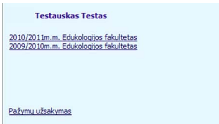
2 pav. Pradinis puslapis

1. Atsidariusiame pradiniam puslapyje spauskite ant nuorodos Pažymų užsakymas .